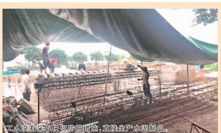
工人没有采取任何防护措施，直接生产水泥制品。