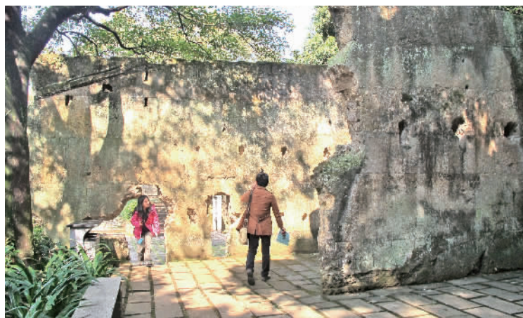
四峰书院遗址吸引游客游赏。

明嘉靖癸未年（1523）太保霍韬称病归里，筑精舍在此讲学，后易名为书院；明万历年间，霍韬重孙霍尚守重修；清顺治后，院基渐毁；现部分院