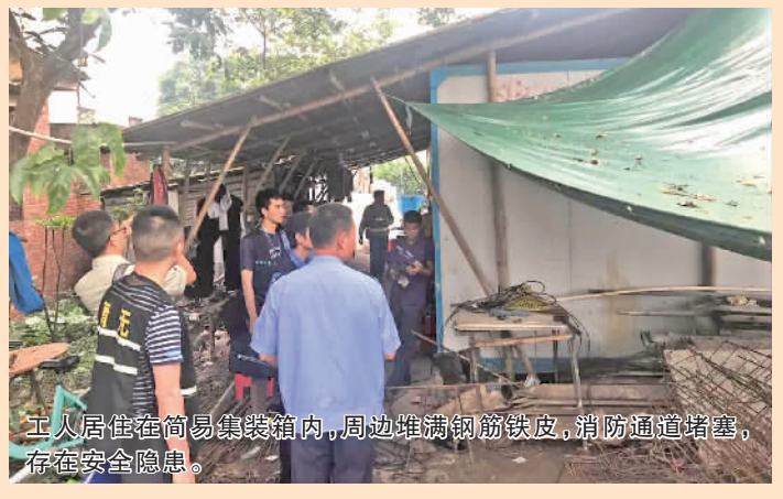
工人居住在简易集装箱内，周边堆满钢筋铁皮，消防通道堵塞，存在安全隐患。