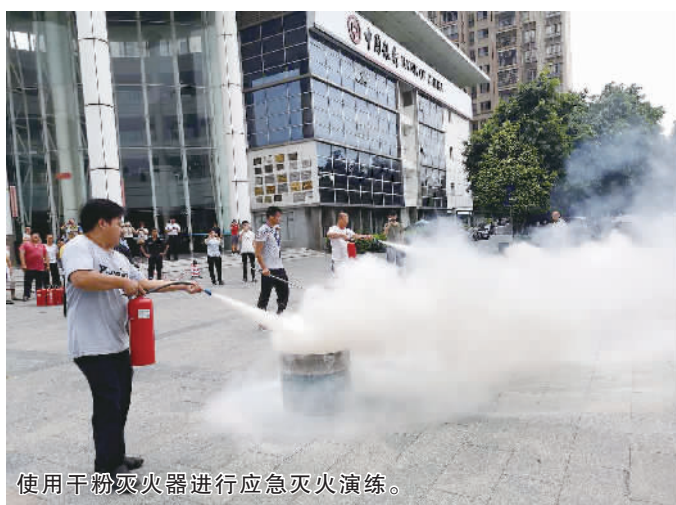
使用干粉灭火器进行应急灭火演练。

会后,在南方创新中心大楼前,大型消防综合演练准备就绪,随着参演人员陆续到场,现场烟雾腾起,演练正