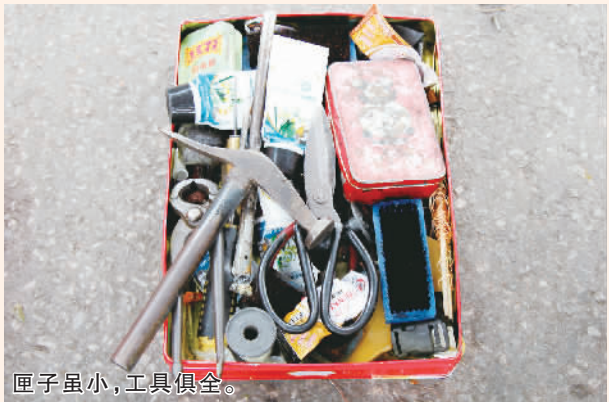
匣子虽小,工具俱全。