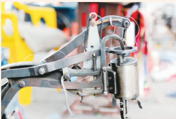
用了20多年的锤针已经留下被岁月磨损的痕迹。