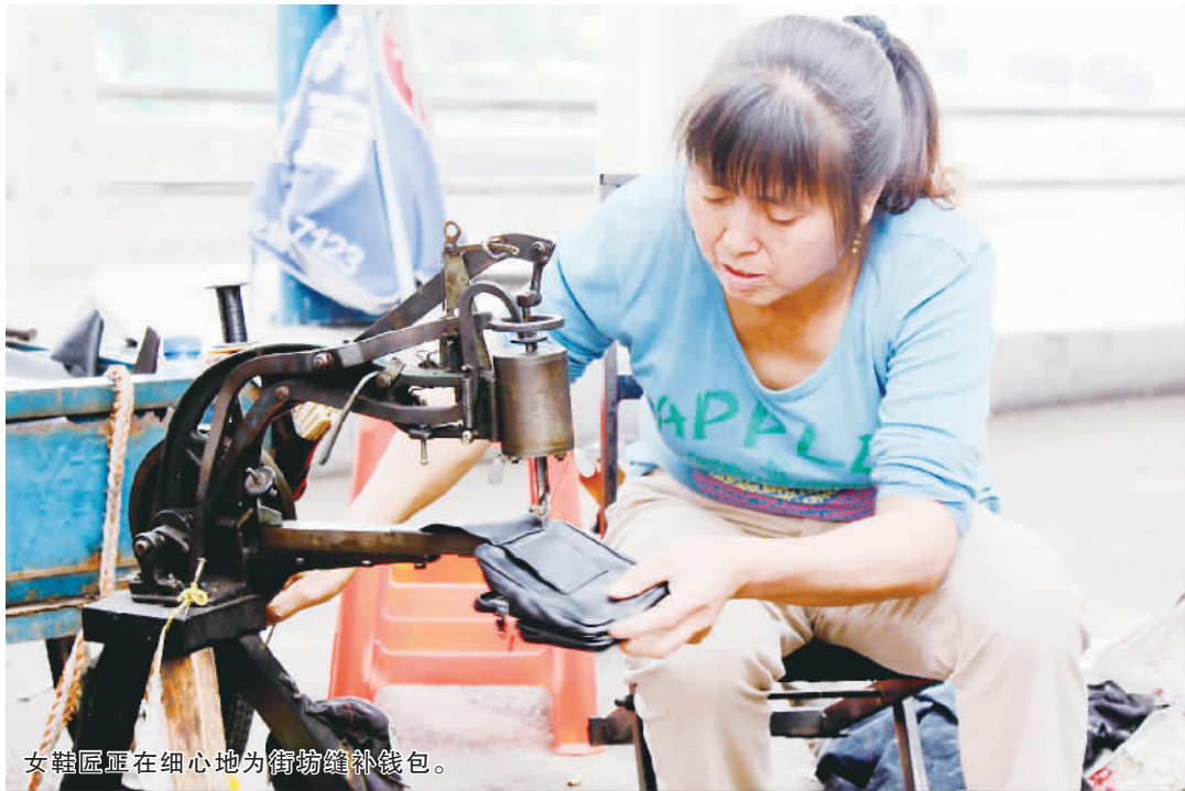
女鞋匠正在细心地为街坊缝补钱包。

20多年来,西樵的城市面貌和各行各业都发生了翻天覆地的变化。唯有她们,一直坚守在文明桥边这块阴凉的榕树底下,一顶帐篷、一部缝纫机、一把锤子、一个匣子,缝缝补补,转眼就是20年。在西樵这20多年日新月异的发展历程中,她们成为了历史的见证者。这么多年当中,街坊们衣着的变化、鞋子的变化、补鞋的频率,她们都记忆犹深,细数起来滔滔不绝。