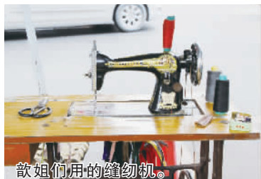
歆姐们用的缝纫机。

在上世纪八九十年代,补鞋匠曾经是一种从业人数较多的职业,因为当时人们的生活条件还没有今天这么好,很多物品还是修修补补继续用。如今,随着市场的缩小,这个行业也在衰落,甚至面临着被淘汰的局面。但在我们小城镇或者农村地区,“补鞋”还是有一定的市场需求。但现实中很多人觉得这种行业又脏又累,从业者甚至受到歧视。其实这些手艺人他们的劳动价值,应当得到更多的关注和尊重。