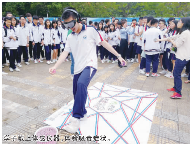
学子戴上体感仪器,体验吸毒症状。

4月24日下午,“攻关中学习,拒毒中成长”禁毒宣传活动在西樵高级中学举行,2200名学子参加攻关小游戏,在游戏中模拟体验毒品的危害,一起向毒品说“不”。