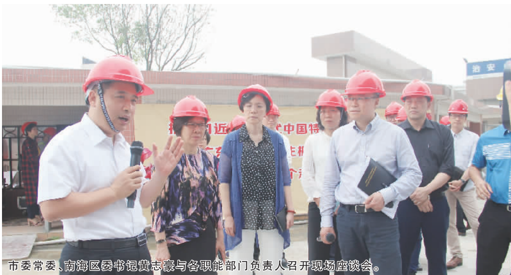
市委常委、南海区委书记黄志豪与各职能部门负责人召开现场座谈会。

去年11月底,西樵镇率先完成了第三轮“广东省教育强县”复评督导验收。下阶段,西樵教育将继续围绕“教育强县”发展战略,深化教育综合改革,全力打造“品质教育在西樵”的惠民教育品牌。“西樵镇5年内计划总投资约5.5亿元,将新增校舍面积约12.7万