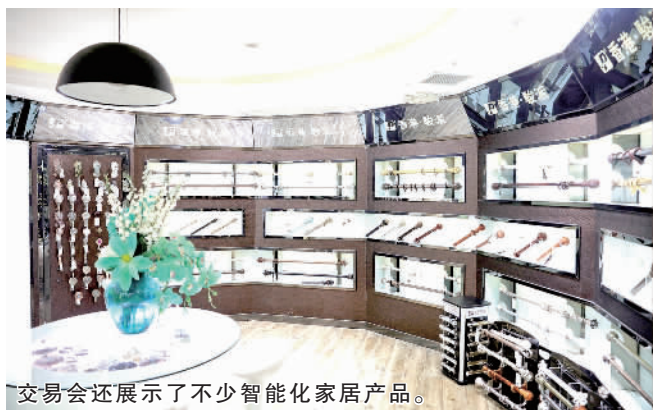
交易会还展示了不少智能化家居产品。