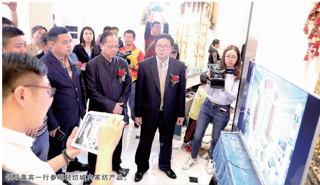
领导嘉宾一行参观轻纺城内家纺产品。

据统计,交易会首日意向成交额突破了3000万元,吸引了来自湖南、广西、福建、四川、黑龙江、新疆、海南等地200多家采购商。高档精品绣花窗帘、欧美流行提花窗帘及现代轻奢窗帘、智能窗饰轨道系列产品、高档智能遮阳系列产品尤为受欢迎,成为集中采购对象。