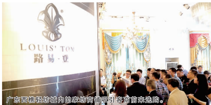
广东西樵轻纺城内的家纺商铺吸引客商前来选购。