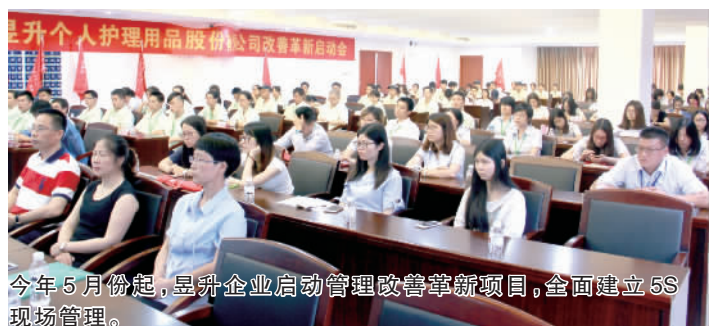
今年5月份起,昱升企业启动管理改善革新项目,全面建立5S现场管理。

面对堆积如山的产品库存,零落不堪的车间,能生产出让消费者用得放心的产品吗?12月16日,广东昱升个人护理用品股份有限公司对员工进行5S现场管理法和企业文化培训,旨在培养员工良好的工作作风,提升员工的工作技能,让员工更好更快地融入昱升企业,为企业长远发展提供动力。