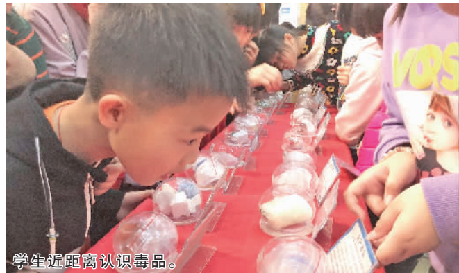
学生近距离认识毒品。

“奶茶粉超市也有卖啊,这个我们要怎么区别呢?”3月7日,在狮山镇罗村中心广场的招聘会上,罗村派出所借此机会设立了咨询摊位,许多求职者被摊位前的毒品模型所吸引。除了开展禁毒宣传,民警现场还讲述了防范电信诈骗相关知识和招聘类诈骗案例,引起不少