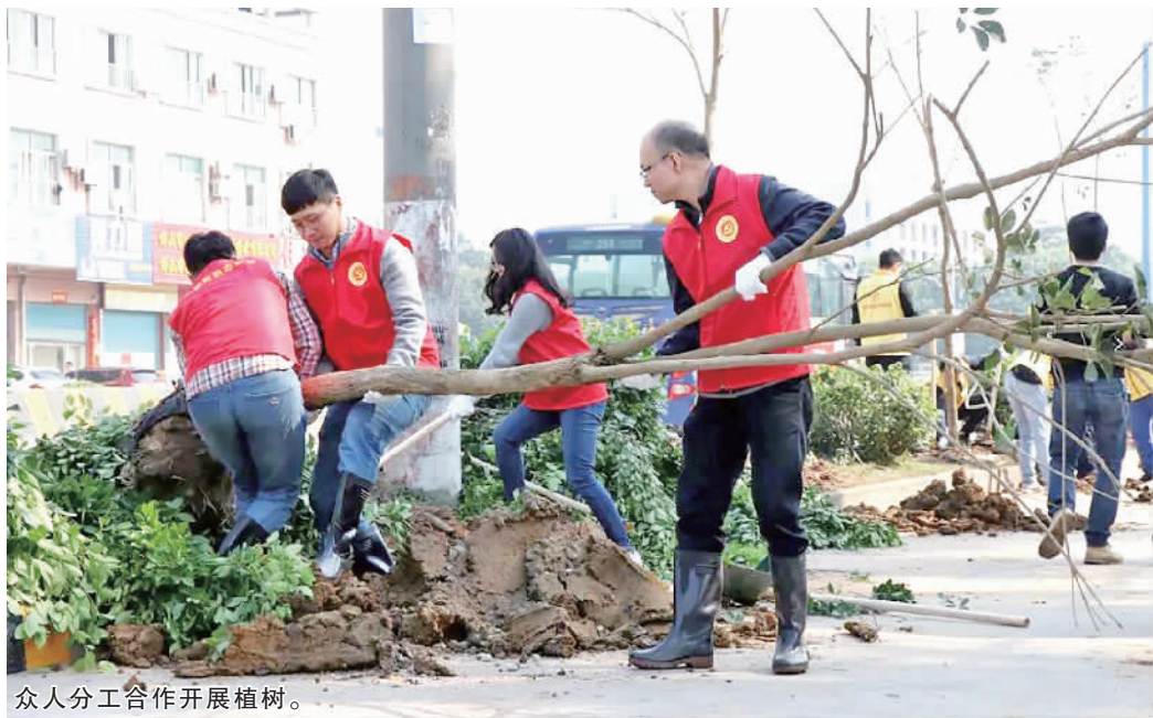
众人分工合作开展植树。

“狮山越来越美了，可以赏花的地方越来越多，我们很高兴能为美化狮山家园出力。”参加植树的南海区人力资源和社会保障局狮山分局局长