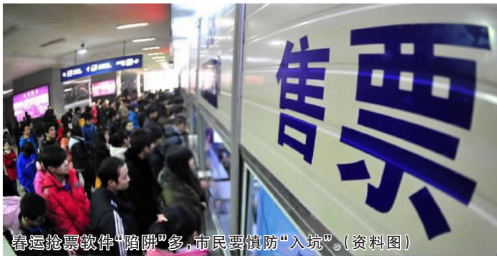
春运抢票软件“陷阱”多,市民要慎防“入坑”。(资料图)

给软件,软件方登录后不断刷新购票页面获取余票信息,这种下单速度虽说比人工购票更快,但能否买到车票最终还是要看12306的放票情况,并非拥有优先购票权,因此购买了加速包未必就能买到票。