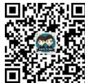
南海公共法律服务