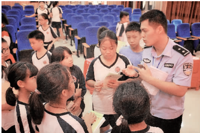
大批学生留下来向民警咨询有关毒品的知识。

“新型毒品通常以香料、花瓣、烟草等形态出现,青少年出于好奇或被诱惑下容易误食。”10月8日,由狮山镇官窑派出所和启明星驿站主的“无毒青春·健康人生”法治教育活动在松岗桃园小学举行。