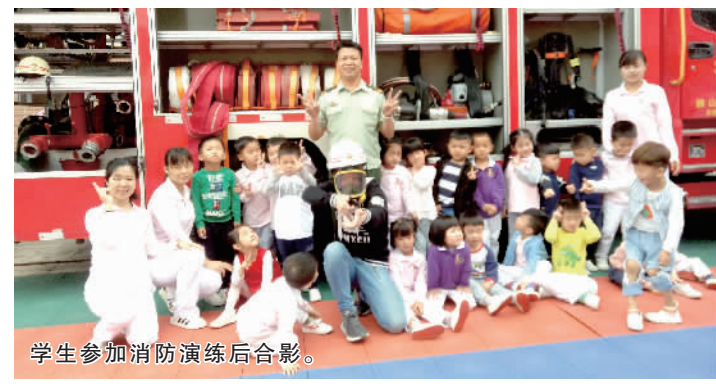
学生参加消防演练后合影。