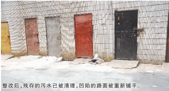
整改后,残存的污水已被清理,凹陷的路面被重新铺平。

据悉,工农路39号是传统的老旧独栋楼房,居住有50多户住户,由于该居民楼没有物业管理公司进驻,其基础设施无人管理和维护,加上路面长年累月被汽车碾压,导致楼下化粪池排污管道及雨水井前不久被碾压下来的沙石堵塞,污水无法排出,并溢出至路面形成一个臭水坑,总面积达40多平方米。随着气温的升高,污水发出阵阵恶臭,而长期积水也容易孳生蚊虫,周边居民迫切希望对此进行整改。收到居民反馈后,劳动社区立即派出工作人员到现场核实,并将情况汇报给驻点联系部门——街道组织工作办,希望其帮助协调解决。随后,在其协调下,街道国土城建和水务局制定了具