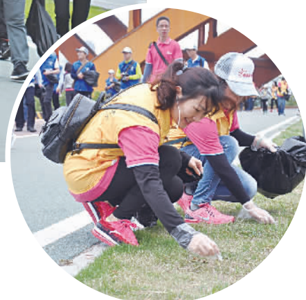
志愿者拾起沿途垃圾。