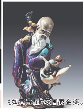
《如意寿星》获国家金奖。