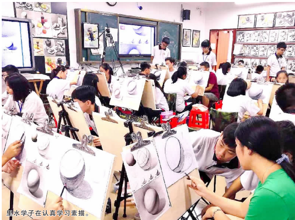
里水学子在认真学习素描。

近日,佛山市2019年高中阶段学校招收体艺特长生术科考试成绩公布,里水镇艺术中考成绩再上新台阶,连续三年术科上线人数创新高,今年总上线人数破两百大关,达213人,较去年增加33人,增幅达18.3%。