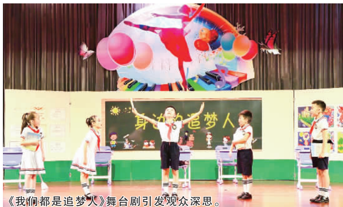
《我们都是追梦人》舞台剧引发观众深思。

本次大赛分为幼儿园专场和中小学专场,镇内共37所幼儿园和15所中小学参与。在幼儿园专场,《安心伴你行》《小公鸡和花狐狸》《鹅场里的故事》等精彩节目轮番上演,孩子