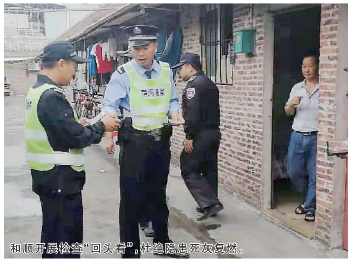
和顺开展检查“回头看”,杜绝隐患死灰复燃。