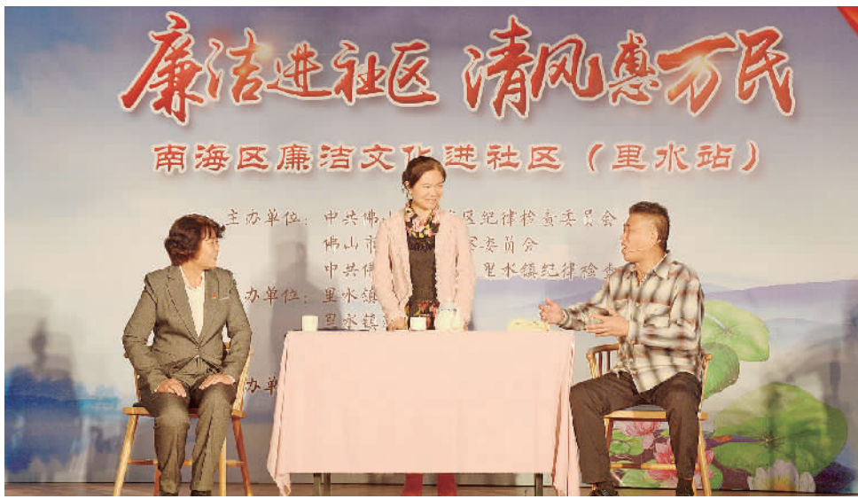
廉洁进社区活动中的《有意思 没意思》小品。

11月30日,由南海区纪委监委,里水镇纪委主办的“廉洁进社区 清风惠万民”活动来到赤山,通过廉洁小品、政策宣讲等形式与现场纪检干部、市民群众一起探讨如何营造一个廉洁的社区氛围。