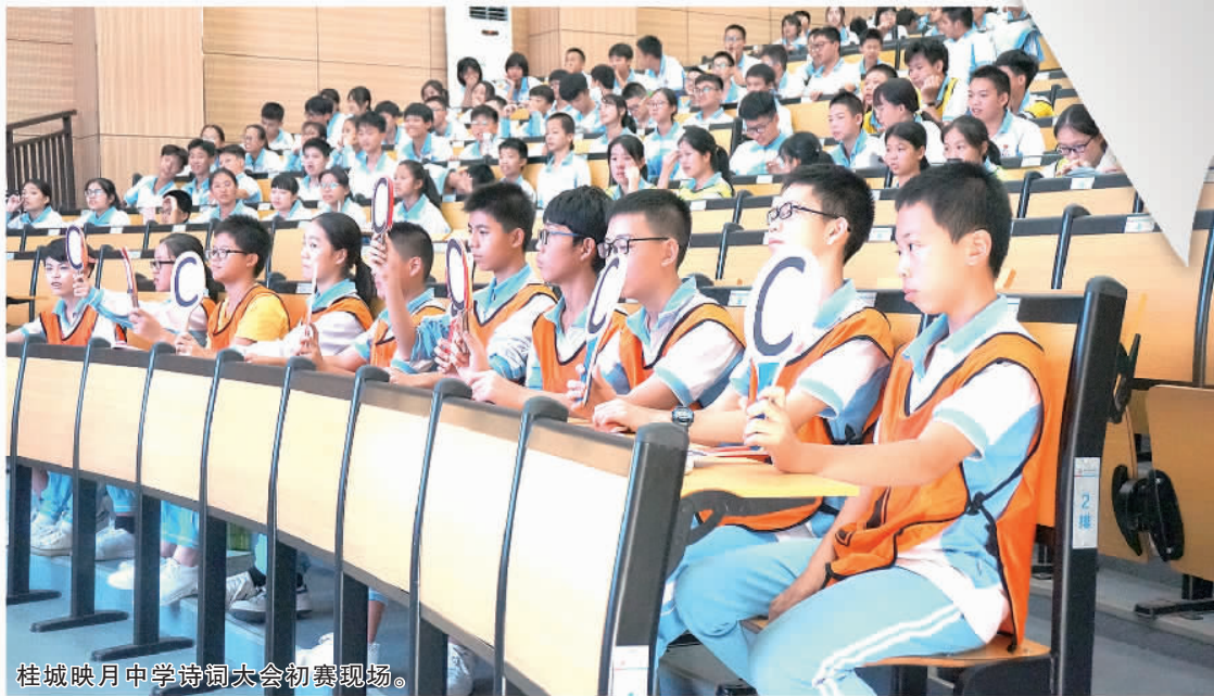
桂城映月中学诗词大会初赛现场。

平洲玉器街是中国珠宝玉石首饰特色产业基地、国家AAAA级旅游景区,全国最大的缅甸翡翠集散地、中国四大玉器市场、三大缅甸翡翠玉器加工生产、批发基地之一、全球最大的光身玉器加工批发基地,享有“玉镯之乡”的美誉;未来致力打造成为南中国特色珠宝产业集群及以玉文化为主题的旅游目的地。