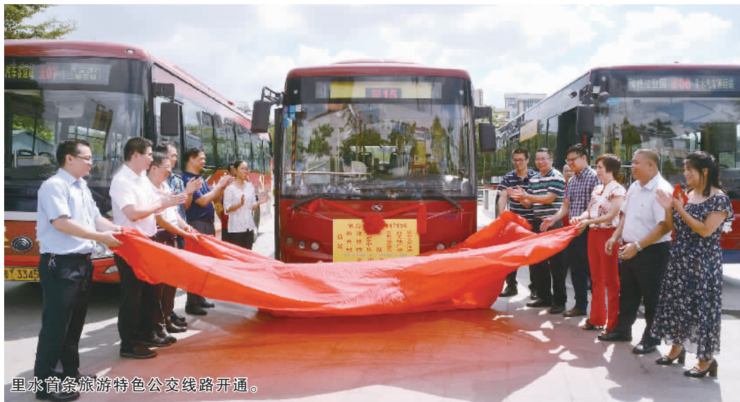
里水首条旅游特色公交线路开通。

当天,里水第一条旅游特色公交线路正式开通,这条线路由镇巴里15线优化调整而成,始于里水艺术河畔,最后到达和顺象台村工业园片区,线路暂时配备6辆公交车。