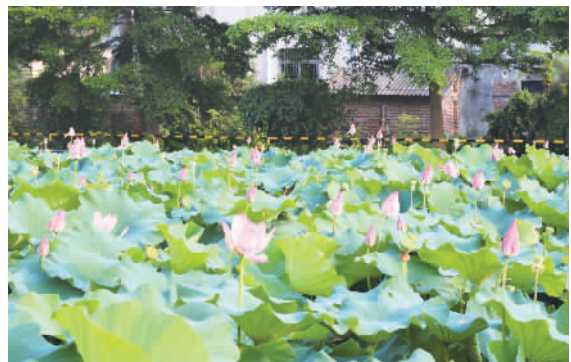
流潮共同文体楼荷塘的荷花正含苞待放。