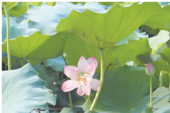
盛开的荷花娇羞地藏于莲叶间。