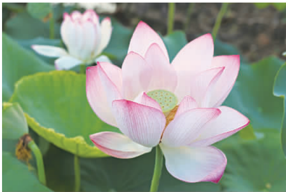
荷花开得甚是好看，粉红粉红的。