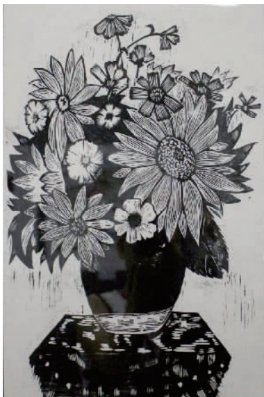
本次展览展出的陈紫云的绘画作品。