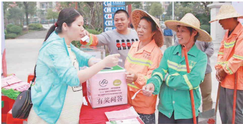
路过的环卫工人积极参与有奖问答。

日前，狮山镇罗村卫生和计划生育办在孝德湖开展“卫计相伴，共创幸福家庭”趣味徒步活动，来自各社区计生协会、罗村医院、狮山镇妇幼保健计划生育服务站罗村分站约250名计生协会会员参与活动，增强凝聚力，倡导健康生活。