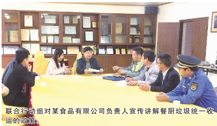
联合行动组对某食品有限公司负责人宣传讲解餐厨垃圾统一收运的政策。

此前，罗村市政获悉，罗村辖区内某快餐连锁的6家分店拒绝接受餐厨垃圾统一收运。当日，行动组来到首先来到其中一家快餐门店了解情况，对该店的厨房卫生环境、厨余垃圾放置等情况进行检查。检查发现，该店餐厨垃圾去向不明，当行动组向店员询问起餐厨垃圾的收运渠道、处理方式等问