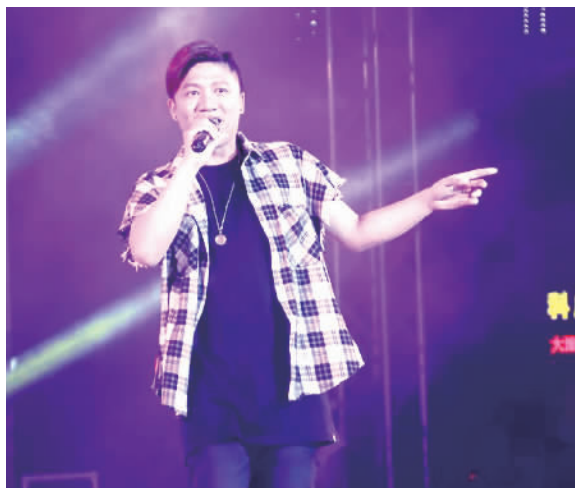
歌手带来《爱的就是你》。