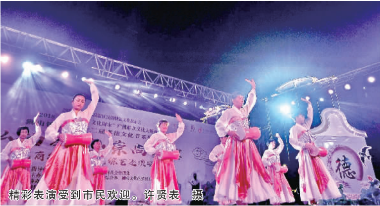
精彩表演受到市民欢迎。