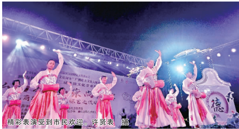
精彩表演受到市民欢迎。