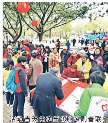
活动当天共送出300多副春联。