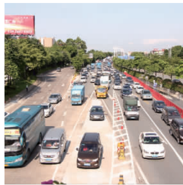
实施封闭后,桂丹路主道(联和段)改道绕行辅道。

近日,笔者从罗村交警中队得知,因佛山地铁3号线(桂丹路站)工程施工需要,中建三局集团有限公司将于8月9日凌晨开始,对桂丹路主道(联和段)进行全封闭施工。据施工方介绍,封闭施工工期预计将持续到2019年3月1日。