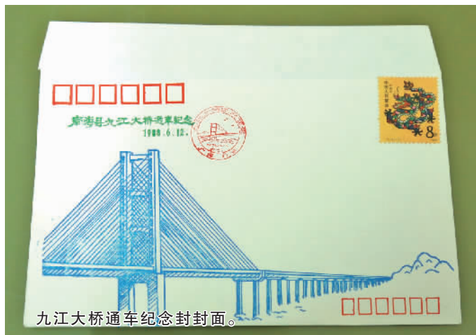
九江大桥通车纪念封封面。

改革开放四十年了,一切都发生了翻天覆地的变化,西江贯通两岸的大桥陆续兴建起来,相信不久的将来,轻轨、地铁,也会为九江人的出行提供更加便捷的交通条件。科技日