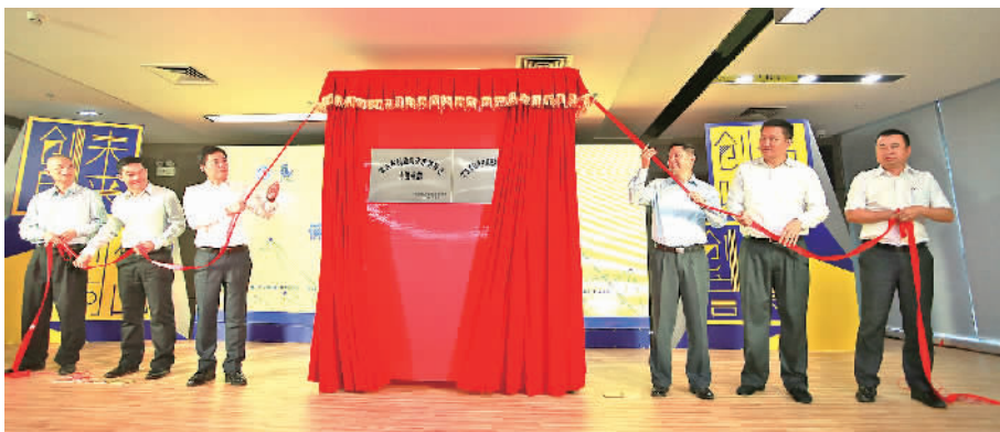
佛山市创业孵化示范基地正式开园。

现场首先播放了佛山双创宣传片,领导嘉宾和到场的创业者们通过观看短片,共同了解近年佛山双创的工作成效。随后,佛山市创业孵化示范基地正式开园。该基地是广东省第二批省级区域性(特色性)创业孵化基地,位于智慧新城核心园区T11栋,以服务初创者、初创企业和初创团队为基本定位,以高校大学生创业者、海外