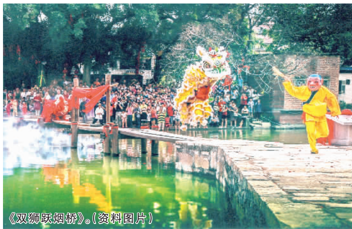
《双狮跃烟桥》。(资料图片)

近年来,烟南村着力烟桥古村活化,根据古旧建筑的特点和所蕴含的历史文化,对古旧建筑进行再利用,打造出