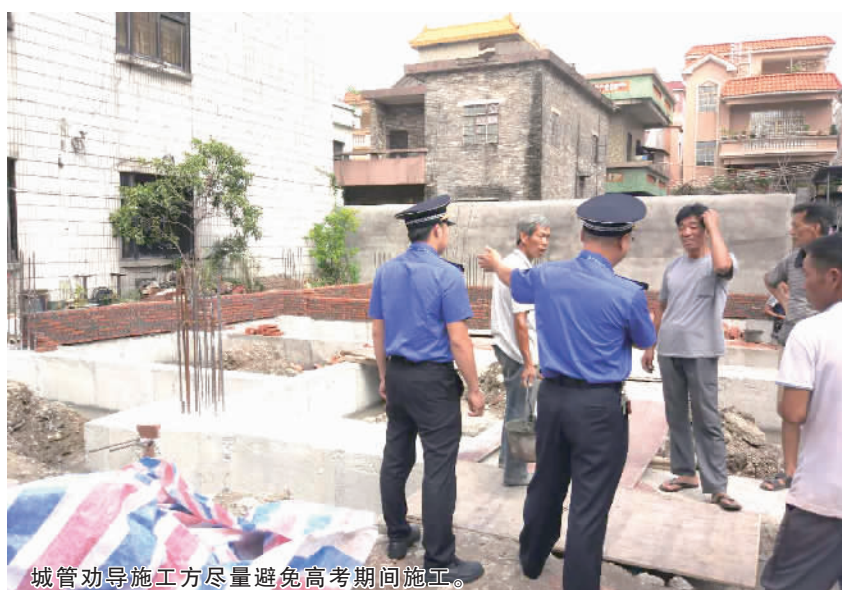
城管劝导施工方尽量避免高考期间施工。

市民:高考快来了,我们要提供一个良好的学习环境给学生,希望有关部门能加强这方面的巡查工作。