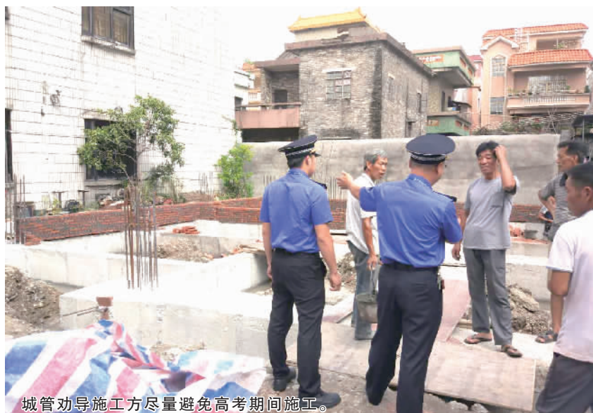
城管劝导施工方尽量避免高考期间施工。

市民:高考快来了,我们要提供一个良好的学习环境给学生,希望有关部门能加强这方面的巡查工作。