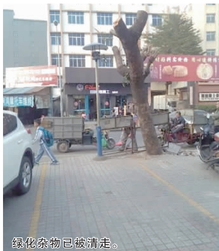
绿化杂物已被清走。

九江数字城管中心:收到反映,在安排工作人员核实后,及时将案件派至九江市政部。目前,市政工作人员已对绿化垃圾进行清扫。