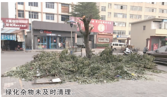
绿化杂物未及时清理。

市民:上北新路骏利鸿摩托车维修店对面,有绿化垃圾未及时清理,影响卫生环境,有损市容。