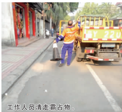
工作人员清走霸占物。

九江城管局:针对市民反映的情况,城管部门已经开展了专项整治行动,对一些私自霸占停车位行为的商家作暂扣物品的处理,并责令