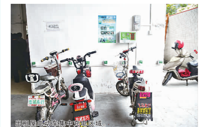
出租屋电动车集中充电区域。