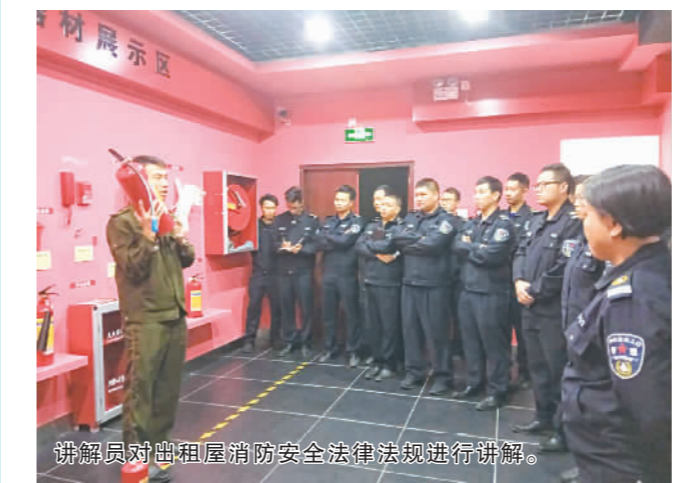
讲解员对出租屋消防安全法律法规进行讲解。