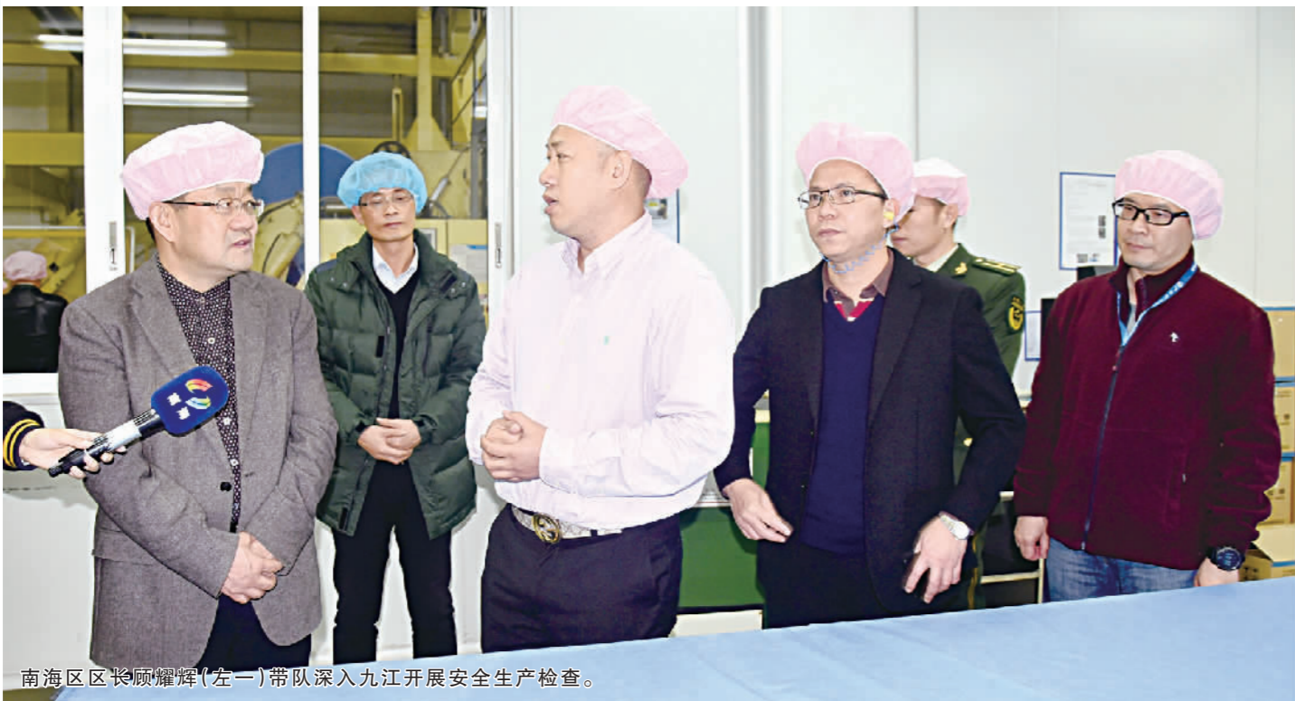
南海区区长顾耀辉(左一)带队深入九江开展安全生产检查。

安全生产永远在路上。自南海区开展安全生产大排查大整治行动以来,九江迅速响应,并构建“1+6”攻坚模式,通过组建综合执法队伍,推行网格化“五层次”全链条联动机制,集中开展“负面清单”企业挂牌督办综合整治行动等举措,铁腕治理安全生产(消防)隐患,同时抓亮点工作推广,树立典型标杆,多渠道共保平安九江。