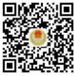
南海公证 微信二维码