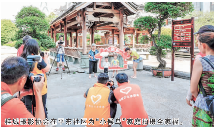
桂城摄影协会在平东社区为“小候鸟”家庭拍摄全家福。

其中,在2018年7月28日至8月5日,桂城摄影家协会分别在平东、平西、平胜、石碓、千灯湖社区以及映月湖公园等地开展了“全家福”拍摄行动,服务家庭210户。“帮这些家庭拍照,他们感到很开心,我们也收获了快乐,所以一听到有这种