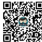
南海公共法律服务