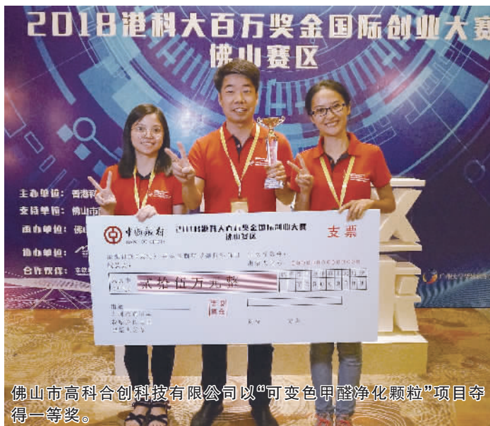
佛山市高科合创科技有限公司以“可变色甲醛净化颗粒”项目夺得一等奖。

当日,参赛队伍借助PPT展示、口头演讲等方式分别从项目主旨、市场分析、竞争分析、经营及实施策略和团队能力等方面进行全面的汇报。