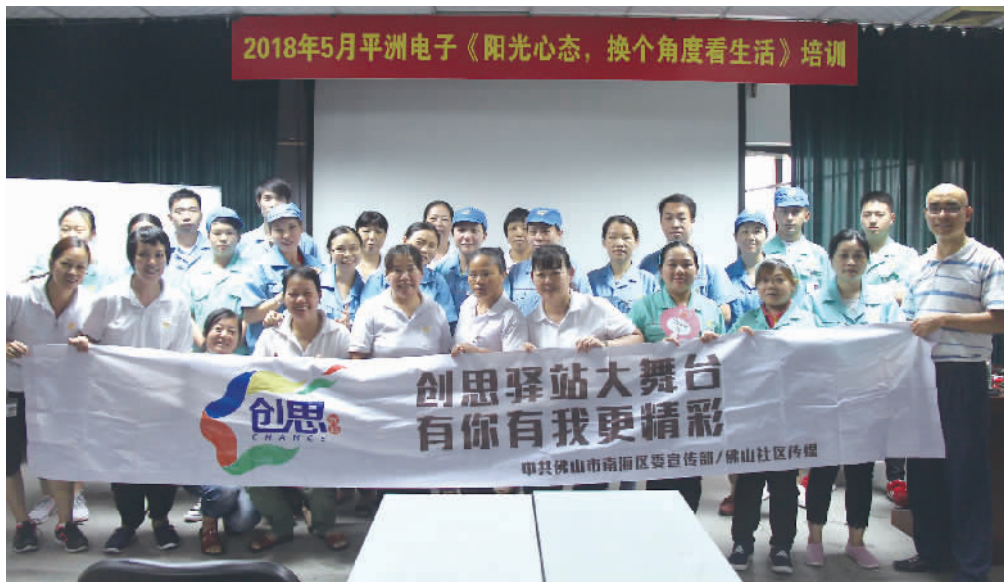
桂城街道创思驿站在广东昭信平洲电子有限公司举行了创思大讲堂活动。