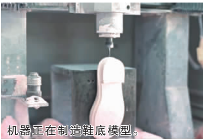
机器正在制造鞋底模型。