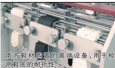
南方鞋材购置的高端设备,用于检测鞋底的耐折性。