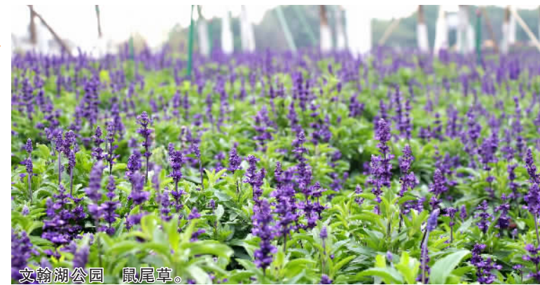
文翰湖公园 鼠尾草。