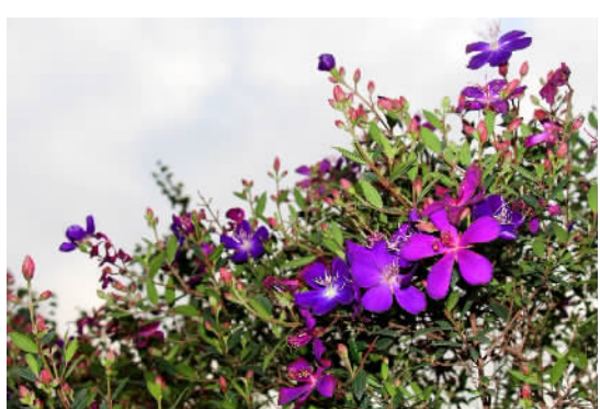
三山森林公园 巴西野牡丹。