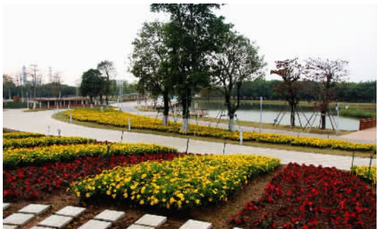
文翰湖公园 情人花坡。