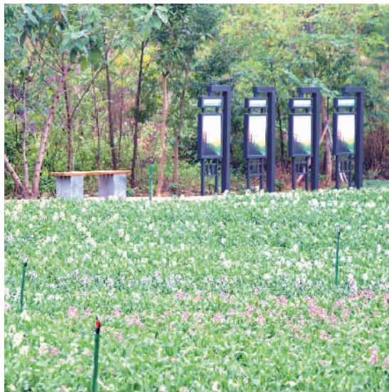
三山森林公园 各色紫罗兰。

在三山新城,有两片“花海”更是花团锦簇,姹紫嫣红。三山森林公园和文翰湖公园“漫山遍野”的炮仗花、山茶花、紫罗兰、木春菊、鼠尾草、四季秋海棠、巴西野牡丹等,装点着游人的旅途,也让在桂城度过新春佳节的市民有了赏花好去处。在忙碌一年后,到这里来屏蔽喧嚣,没有雾霾,没有沙尘,没有忙碌的身影,只有花海、蓝天和白云……生活惬意,快哉!