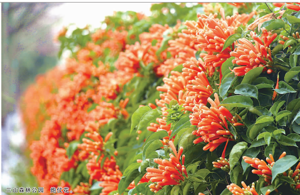
三山森林公园 炮仗花。