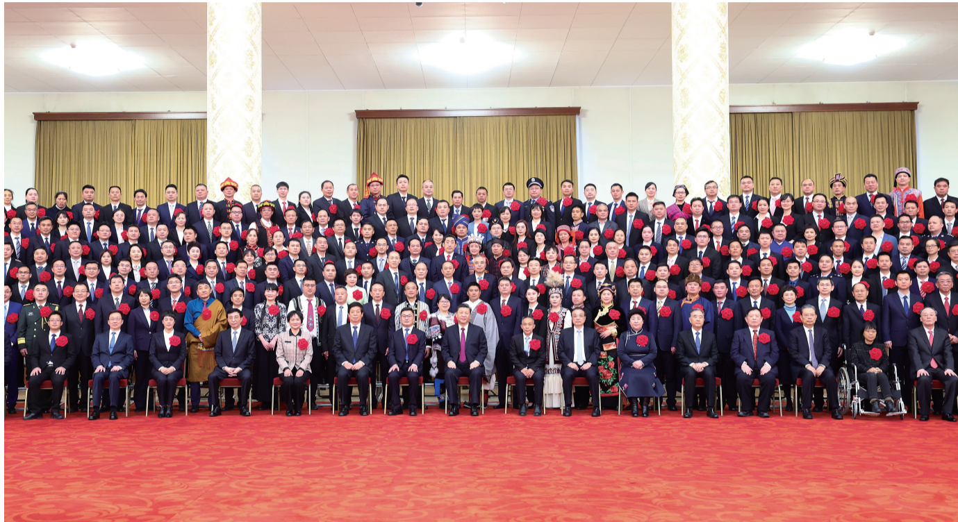
■2月25日,全国脱贫攻坚总结表彰大会在北京人民大会堂隆重举行。中共中央总书记、国家主席、中央军委主席习近平在大会上发表重要讲话。