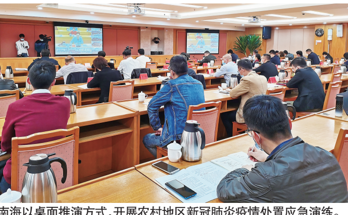
南海以桌面推演方式，开展农村地区新冠肺炎疫情处置应急演练。