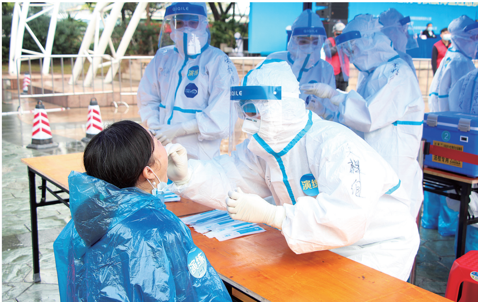
南海在丹灶开展大规模人群核酸筛查应急演练，医务人员有序对采样对象进行采样。

据介绍，目前已由区疾控中心、15家公立医院和9间社区卫生服务中心派员组成核酸采样人员信息库，能组建4000人的核酸采样队伍，同时，全区共有14家医疗机构和5家第三方检测机构参与南海区新冠病毒核酸检测，可满足极端情况下快速完成南海区全员新冠核酸检测的需求。