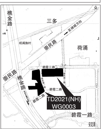
佛山市公共资源交易中心南海分中心 2021年1月22日

备注: 本宗地设有保底价。 二、中华人民共和国境内外的自然人、法人和其他组织,除法律、法规另有规定外,均可申请单独或联合参加竞买活动。 三、参与佛山市国有建设用地使用权公开出让的购地资金必须为竞买人的自有资金,不得为银行贷款、债券融资、信托资金、资管计划配资、保险资金、股东借款等。 四、本次国有建设用地使用权网上挂牌采用增价方式进行报价,按照价高者得的原则确定竞得人。 五、有意参与竞价者可登录佛山市国有建设用地使用权和矿业权网上交易系统(下称“网上交易系统”),网址: http://jy.ggzzy.foshan.gov.cn:3680/TPBank/newweb/framehtml/onlineTradex/index.html)以及佛山市南海区人民政府网(自然资源局链接: http://www.nanhai.gov.cn/fsnh/wzjyh/szzyjnhf/znj/index.html)或交易中心链接: http://www.nanhai.gov.cn/fsnh/wzjyh/ggzzyjyzx/znj/index.html)下载相关出让文件。 六、本宗地的公告期自2021年1月22日至2021年2月14日止;网上报价期限为2021年2月15日8时30分至2021年2月25日10时止。竞买保证金须于2021年2月23日17时之前到达本中心指定账户后,方可参加竞买。上述时间均以网上交易系统的服务器时间为准。 七、需要到交易地块现场踏勘的竞买人请与佛山市公共资源交易中心南海分中心联系。 八、本次网上挂牌仅接受网上竞买申请和竞买报价,不接受书面、邮寄、电子邮件、电话、传真、口头等其他形式的申请。 九、自本公告起至网上挂牌截止期间,如有关于本宗地竞买文件的修改、澄清、说明等将通过网上交易系统以及佛山市南海区人民政府网发布,请有意参与竞买者密切留意。其它未尽事宜,详见本宗地的网上挂牌出让文件。 十、联系方式: (一)业务咨询: 0757-81631272、86369923 (二)系统使用咨询: 吴先生 0757-83991581 (三)地址: 佛山市南海区桂城街道桂澜北路8号