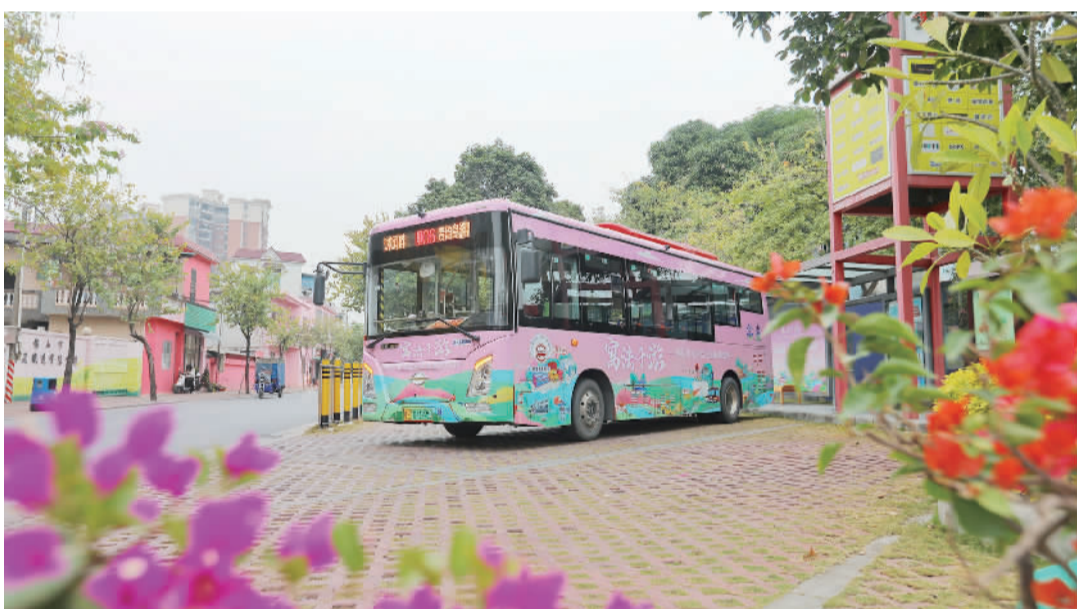
■里06公交线路是一条以“法治+旅游”为特色的“美丽乡村公交线路”。

这是一条独具里水特色的法治文化旅游路线,随着里06公交线路画卷而展开,从起点到终点,八大普法阵地缓缓揭开她美丽的面纱,寓情于法,融法于景。人们可以一路随着公交前进的站点领略美丽的乡村法治文化旅游景点。在休憩和游玩的同时感受美德善行与法治文化的双重熏陶,借法治之力推动乡村振兴。