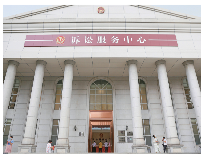
南海法院诉讼服务中心。(资料图片)

2019年6月起,南海诉前和解中心和5个诉前和解工作室(驻法庭)陆续成立。该中心和辖区、远程视频设备、速裁庭一应俱全,整合司法、公安、人