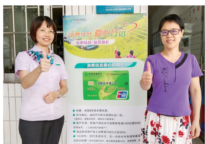
农行南海分行大力推行“消费扶贫爱心卡”。(资料图片)

在上级指导下,农行南海分行联合南海区工会、扶贫办,深入贯彻习近平总书记关于开展消费扶贫行动的重要讲话精神,面向社会爱心人士,率先在南海发行“消费扶贫爱心卡”,并采用“线上+线下”模式,多点