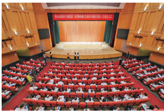
南海区全面建设广东省城乡融合发展改革创新试验区工作推进大会召开。

委印发《佛山市南海区建设广东省城乡融合发展改革创新试验区实施方案》(简称《实施方案》),明确了试验区建设的“时间表”和“总路线图”。