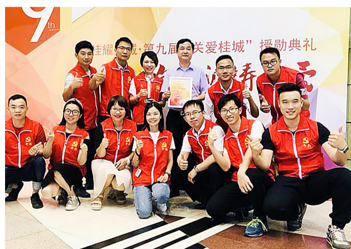
桂城平西社区获评“全国最美志愿服务社区”。

2013年,社区党委找到一块“敲门砖”——青年党员核心团队,希望通过年轻党员激活社区的新动力,引导社区居民参加志愿服务,共同建设社区。然而,团队开展的第一个活动就“碰壁”了:想要策划“五一”厨神大赛,但只有两三名党员来参