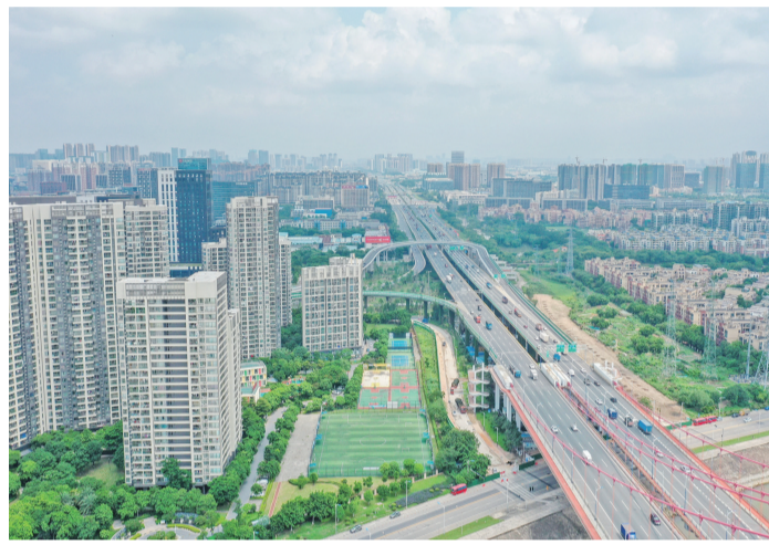
南海着力打造“湾区枢纽区域、西部交通门户”。