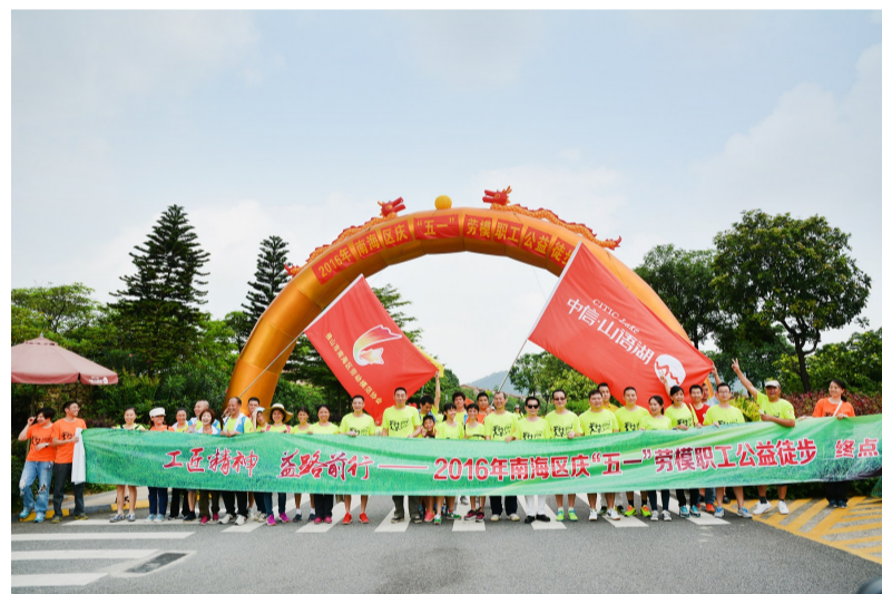
■“工匠精神 益路前行”——2016年南海区庆“五一”劳模职工公益徒步活动在里水中信山语湖举行。

■2019年11月9日,里水镇第三届“幸福家”职工婚礼隆重举行,32对职工伉俪完美结合,见证里水最甜蜜盛事。