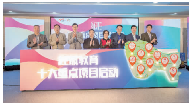
■今年1月9日,桂城街道启动十大教育“卓越·续航”计划。

桂城教育质量长期位居全市前列,中小学生学习质量、学生学科竞赛、教师技能展示活动等,以绝对优势领先,特别是中考优生人数一直在高歌猛进。要保持持续的优势,就要不断突破和变革,南海人“敢为天下先”的精神,也深深烙印在桂城教育的基因中。