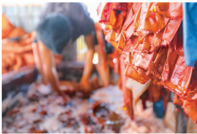
② 纱绸过苳水。纱绸在天然的植物薯苳汁水进行浸染。