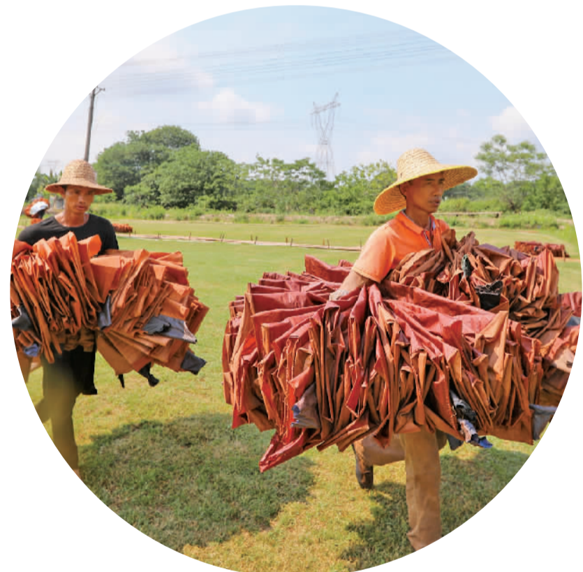
⑧ 晒干的纱绸将继续泡染。