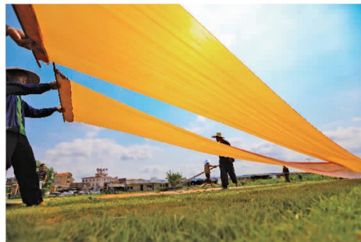
④ 工人们在草地上晾晒纱绸,将其绷直让光照充分均匀。