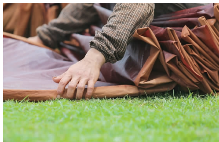
⑥ 柔软的草皮,是晒苳的先决条件。晒苳对草地和阳光的要求都很高,草地要经常修剪。

香云纱,俗称苳绸、云纱,是一种用广东特色植物薯苳的汁水对桑蚕丝织物涂层,再用珠三角地区特有的含矿河涌塘泥覆盖、经日晒加工而成的一种昂贵的纱绸制品。被誉为“岭南瑰宝”、丝绸界的“软黄金”。