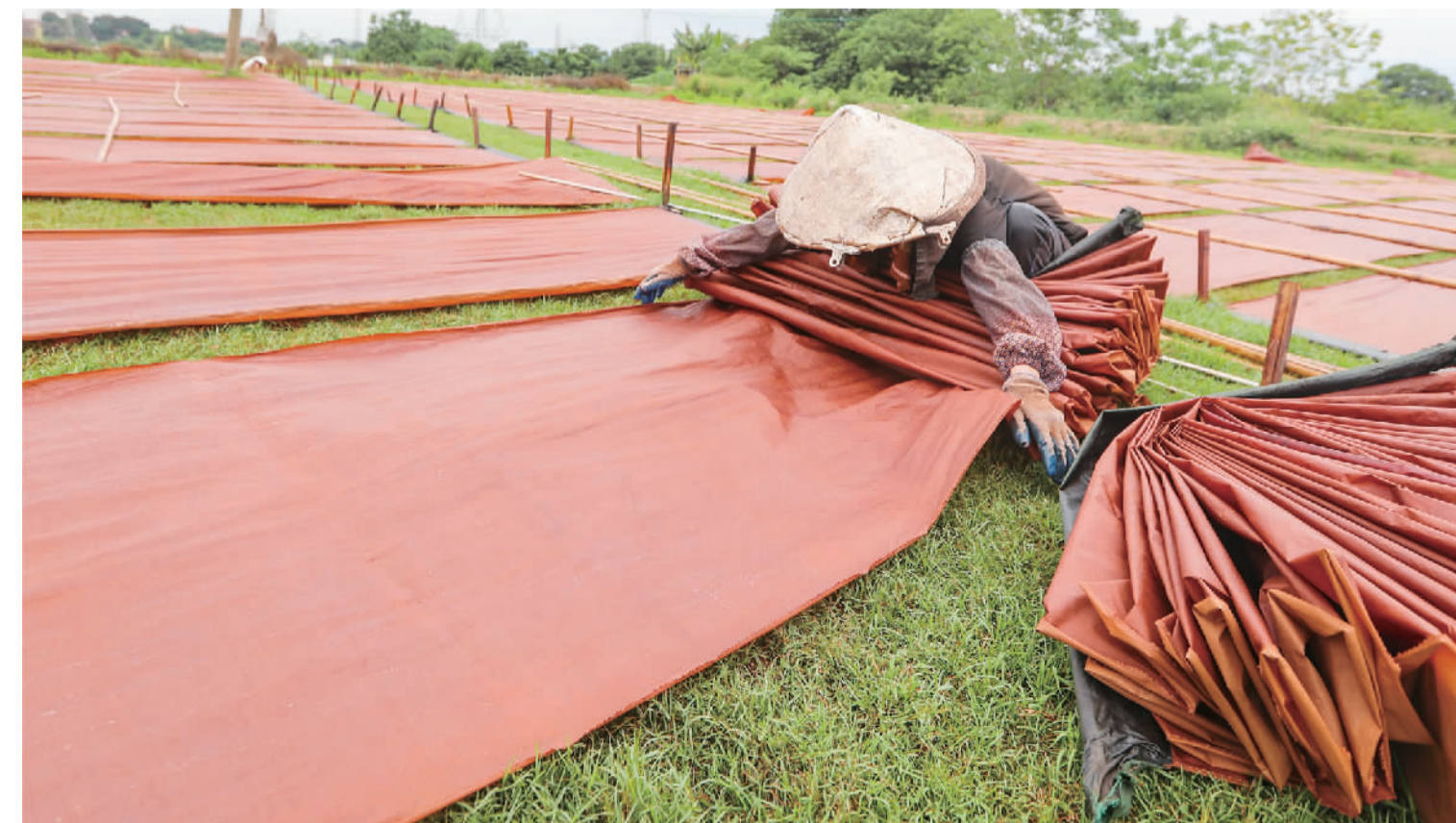
⑦ 工人把晒干后的纱绸卷起。