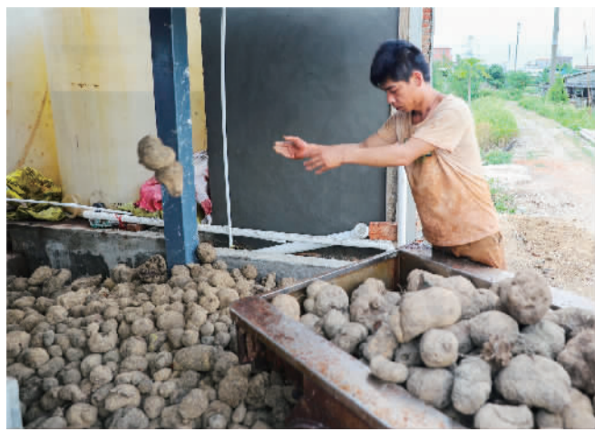
① 过苳水前,工人运来薯苳,用于制作薯苳液泡制香云纱。