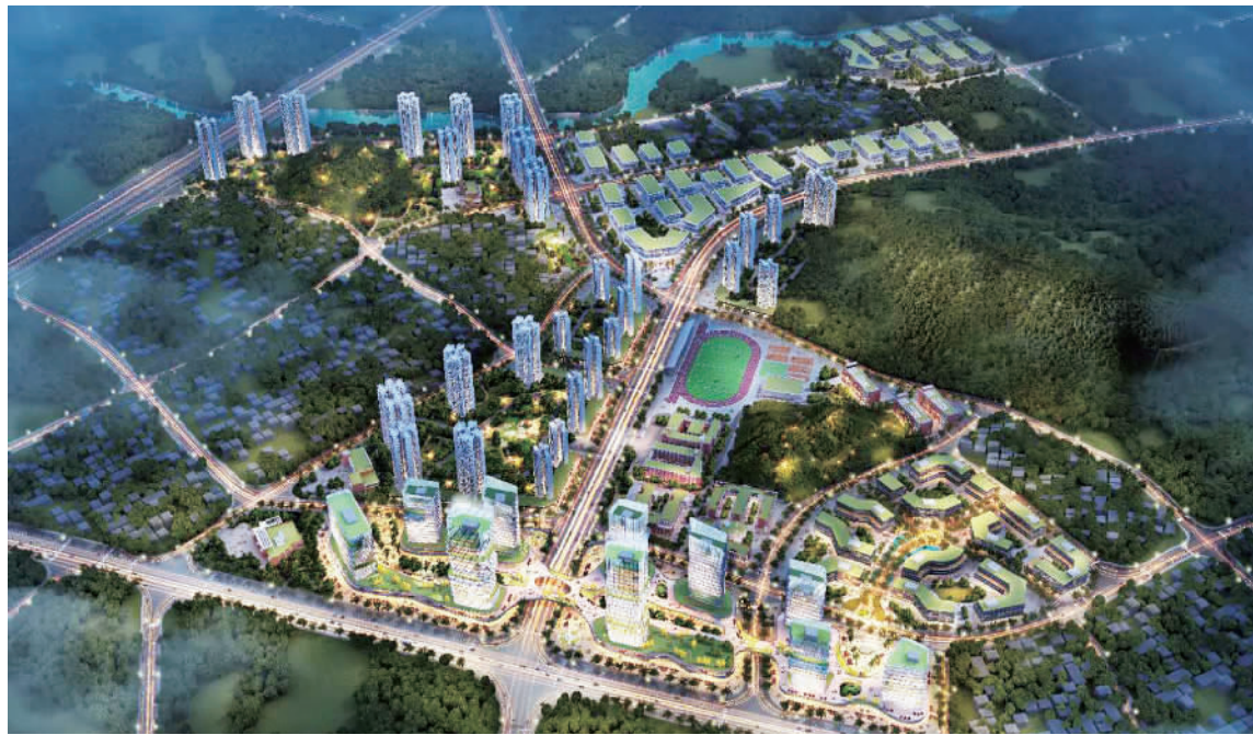
■大冲千亩科技生态工业园改造项目效果图。