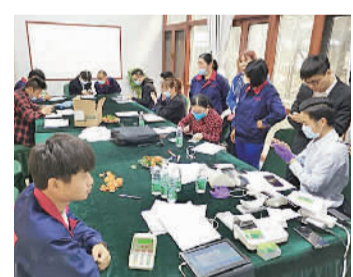
农行南海分行党员志愿者走进企业提供金融服务。

据悉,在疫情期间,农行南海分行属下各支行党员志愿服务队积极走进企业,把窗口“搬”进工厂,把服务送上门,同时积极推广线上服务,实现金融服务“零时差、不断档”,大力支持企业复工复产。(江宛霖 陈丽)