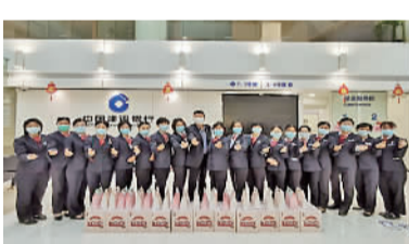
节日慰问活动合照。

日前,佛山建行南海支行开展“与美丽为伴 携幸福同行”活动,向全体员工致以“三八”妇女节慰问并献上节日礼物,向辛勤耕耘在各个工作岗位上的女员工,致以节日问候,对女员工们为建行改革创新作出的贡献表示衷心感谢。