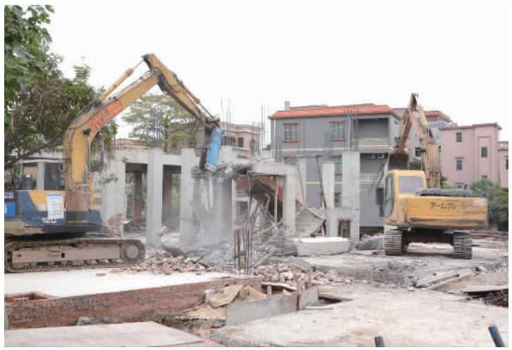
丹灶大力查治“两违”。(资料图片)

丹灶镇以完善的管理架构统筹协调全镇查治工作,有序推进落实各项专项治理。丹灶镇查治违法用地违法建设共同责任制领导小组由丹灶镇镇长