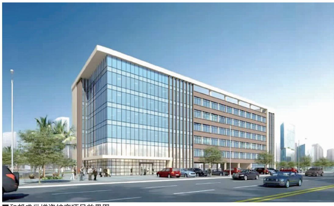
和邦盛世增资扩产项目效果图。

而3月18日,和邦盛世家居股份有限公司中标位于广东新材料产业基地(绿色建筑科技产业园)的3.484公顷集体工